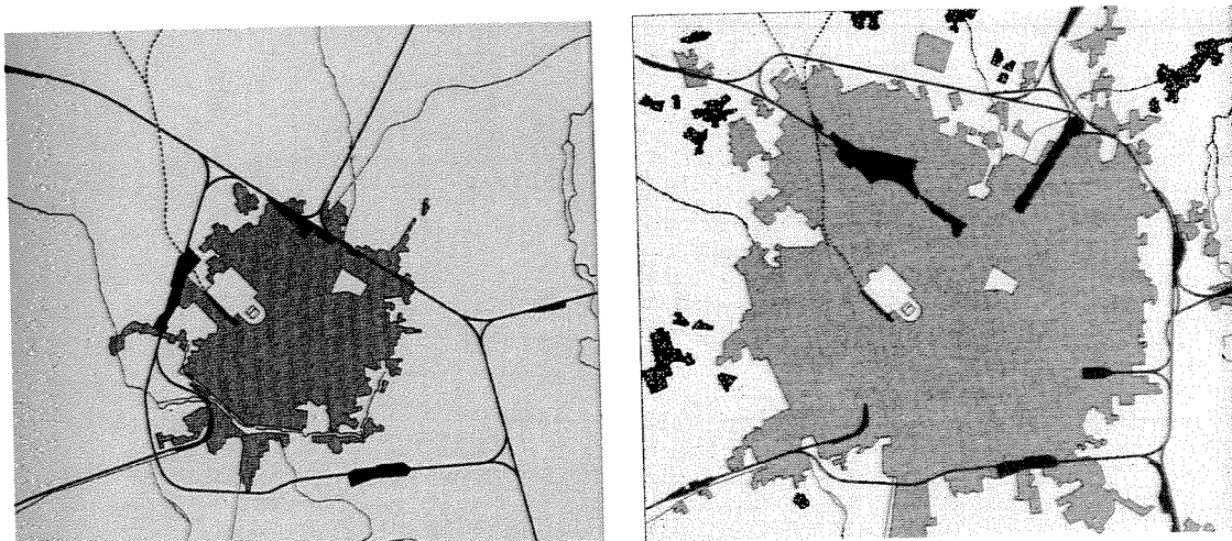
G. De Finetti - Milano, costruzione di una città, 1969; La cintura ferroviaria: 1860/1930 e 1970

Oltre alla Centrale, il piano di riassetto prevedeva un ampliamento dello scalo merci di via Farini andando ad occupare la maggior parte dell'area a Nord del Cimitero Monumentale, nel triangolo di San Rocco. Un nuovo grande scalo di smistamento merci sarebbe sorto oltre Lambrate, accanto alla linea di Venezia; un ulteriore nuovo scalo merci a Porta Vittoria sarebbe stato destinato esclusivamente al traffico ortofrutticolo, per alimentare l'adiacente mercato. Infine dovevano essere potenziate le stazioni di Rogoredo, sulla linea per Bologna, e di San Cristoforo sulla linea di Vigevano.